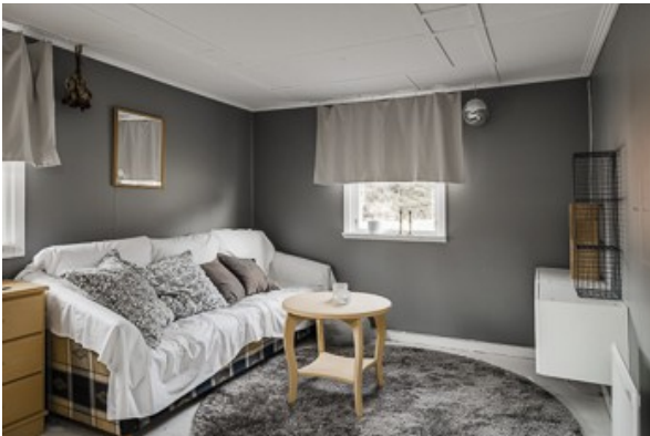
Blick in den Wohn-/Schlafraum