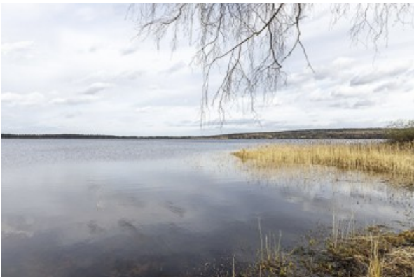
am Seeufer vom Mullsjön