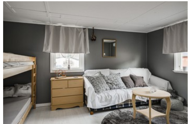
Blick in den Wohn-/Schlafraum