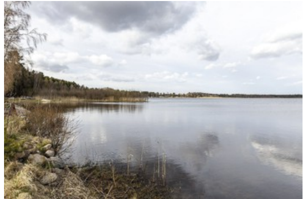
am Seeufer vom Mullsjön