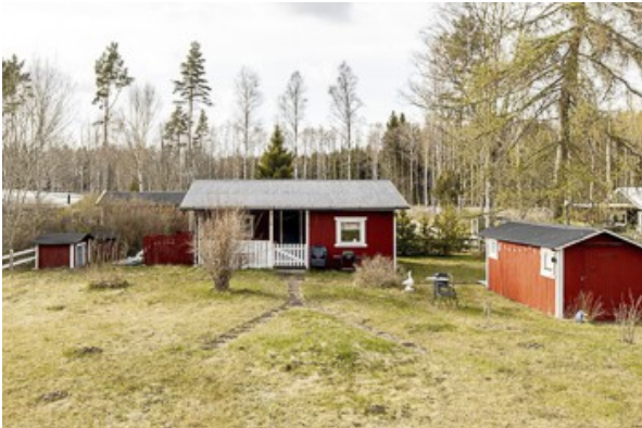
Blick zum Haus