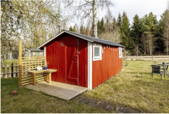
Nebengebäude mit Hygieneraum und Trockentoilette