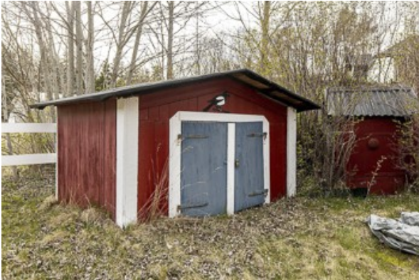
Nebengebäude für Gartengeräte